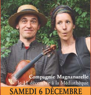
Compagnie Magnanarelle le 11 décembre à la Médiathèque